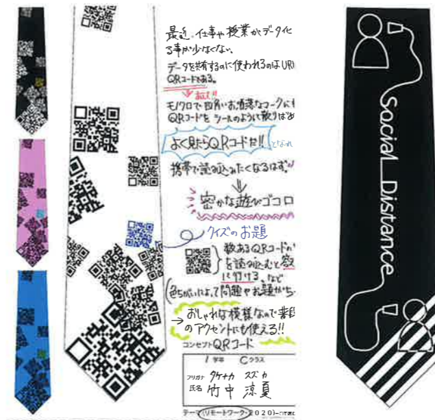
東京ネクタイ協同組合優秀賞（テーマ：リモートワーク）

対象学生が主に1年生ということもあり、制作においては知的財産権に留意し、実社会でのデザイン活動につなげていける様に指導した。応募作品については学生の意気込み、思い入れ、また逆に力の抜けた自然体での物作りなど、様々なアプローチが感じられたと審査員の間で好評であった。染織研究室では昨年度より服装学部の実習授業も行っており、次年度は「デコタイ部門」部門の再開とともに、より多彩な作品に期待して他学部学生参加の可能性も探していきたい。