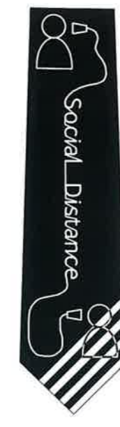
東京ネクタイ協同組合優秀賞（テーマ：2020）