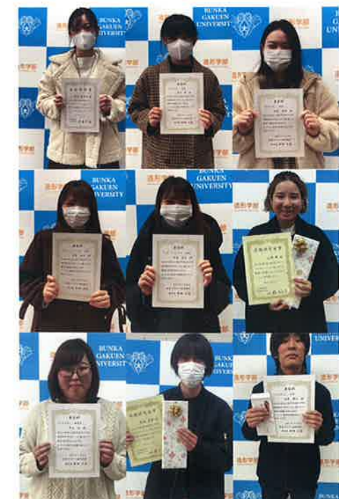
賞状・副賞を対面で受け取った学生は個別に記念撮影を行った